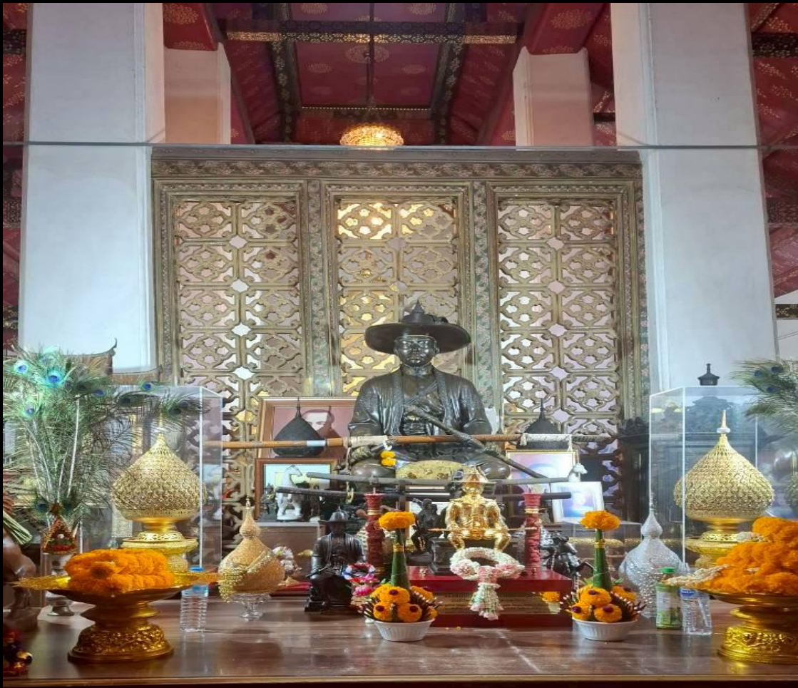
คำกล่าวถวายสักการะ สมเด็จพระเจ้าตากสินมหาราช นะโม 3 จบ โอม สิโน ราเชทเวะ พะยะตุ ภาวัง สัพพะสัตตุ คำถวายเครื่องสักการะ นะโม 3 จบ โอมสิโน ราเชทเวะ นะม